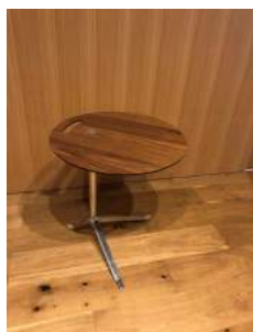
机 3台 直径 45cm 高さ 50cm