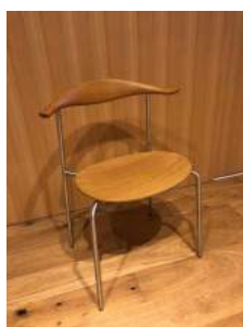
イス 13脚 横 45cm 縦 36cm