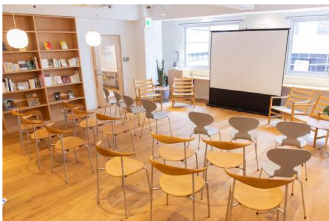
イベントスペース