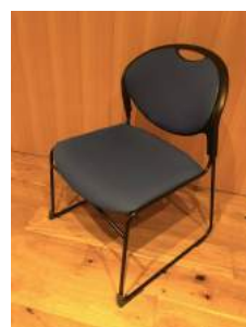
イス 16脚 横 42cm 縦 44cm