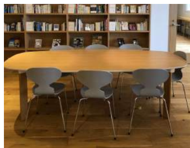
長机 1台 横 245cm 縦 105cm 高さ 72cm