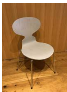
イス 8脚 横 40cm 縦 37cm