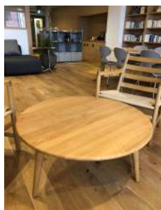
机 1台 直径 87cm 高さ 44cm