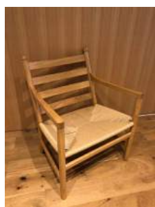
イス 4脚 横 60cm 縦 47cm